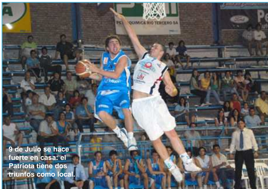
9 de Julio se hace fuerte en casa: el Patriota tiene dos triunfos como local.