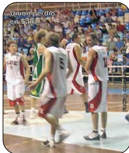
Unión perdió en Salta.